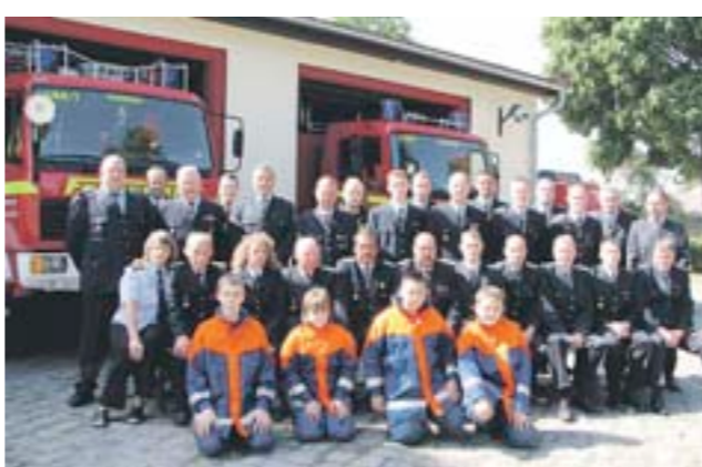
Die Bergfelder Feuerwehr begeht 2009 ihren 100. Geburtstag.