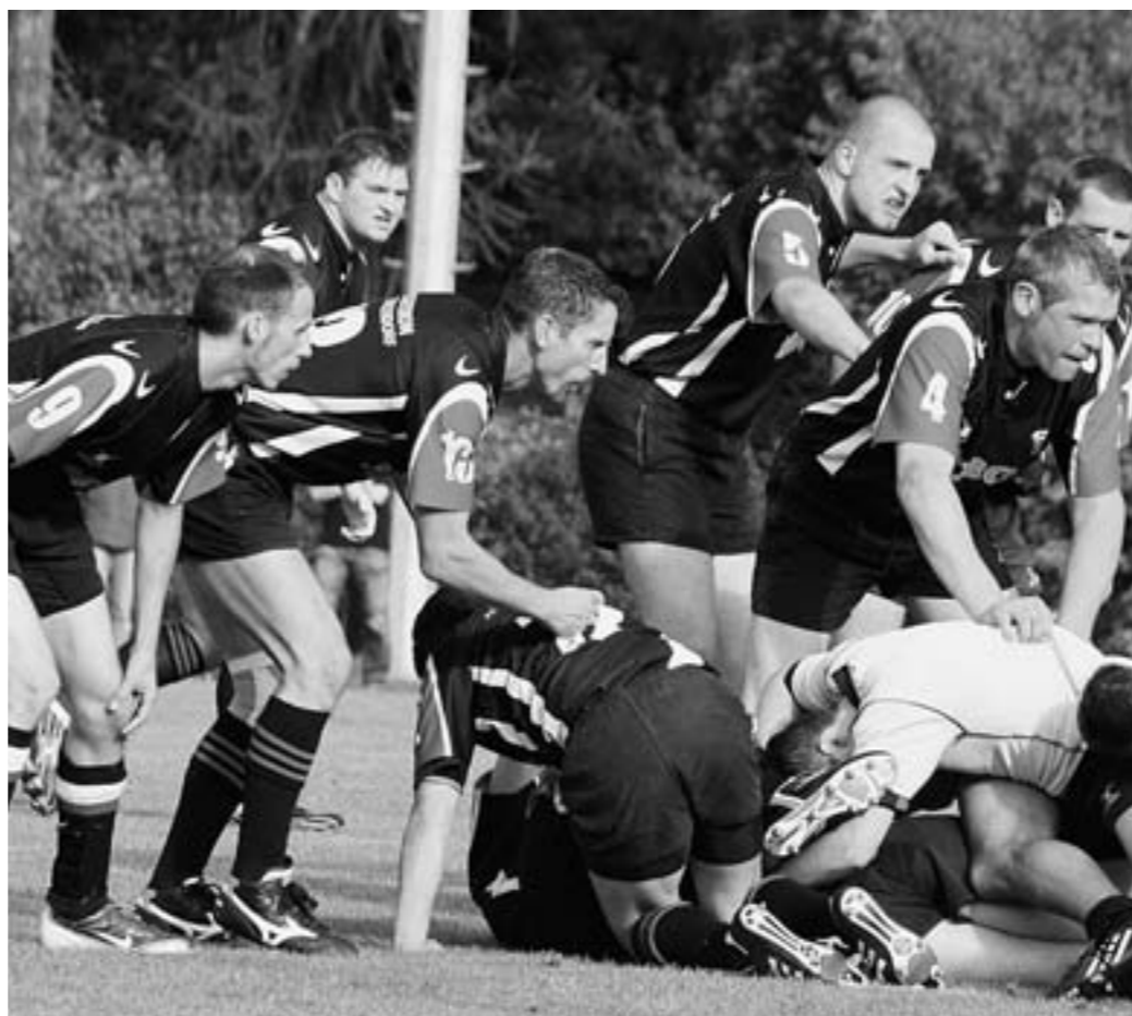
Die Punktspiele der Hohen Neuendorfer Rugby-Union sind für die Anhänger des traditionsreichen Vereins immer ein sportlicher Höhepunkt.

betreuung ist nichtkommerziell, die Wunschgroßeltern erhalten lediglich eine kleine Aufwandsentschädigung. Wer sich selbst als Wunschoma oder Wunschopa zur Verfügung stellen möchte, ist jederzeit beim Stadtverein gern geset. Wuschgroßeltern ist ein Ehrenamt, das der älteren Generation eine Aufgabe gibt, die sie ausfüllt, ihnen gleichzeitig Freude bereitet und sie dabei jung hält. Haben Sie Lust, mit Kindern in der Woche ein paar Stunden zu verbringen und eine Beziehung zu einer jungen Familie aufzubauen, dann melden Sie sich bei Frau Würdich, Tel. 0174/169 2778.