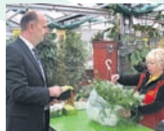
Prominenter Kunde bei Wosch.

Wo der zuständige Minister persönlich gratuliert mag die Bürgermeisterin natürlich nicht fehlen: Glückwünsche und Anerkennung im Namen der ganzen Stadt überbrachte Zossens Bürgermeisterin (Foto, l.v.l.) den diesjährigen Sie-