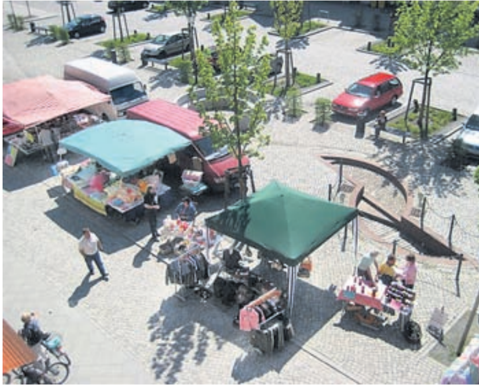
Der Zossener Wochenmarkt im Überblick vom Rathaus. Inzwischen haben die Händler wieder ehemalige Kunden zurückgewinnen können und hoffen auf neue Kunden.

Das erste Sechser-Pack an Wochenmarkt-(Donners-)tagen dauert vom 16.04. – 28.05. 2009