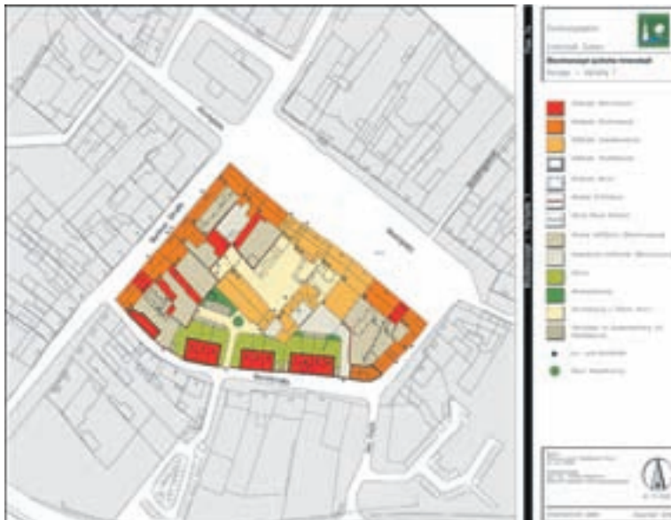
Die Grafik für das Blockkonzept zeigt, wie die geplante Bebauung das Gebiet zwischen Marktplatz und Marktstraße harmonisch ergänzen soll.

lungsmöglichkeiten des Blockes beauftragt. Das Blockkonzept dient zur weiteren Diskussion wie