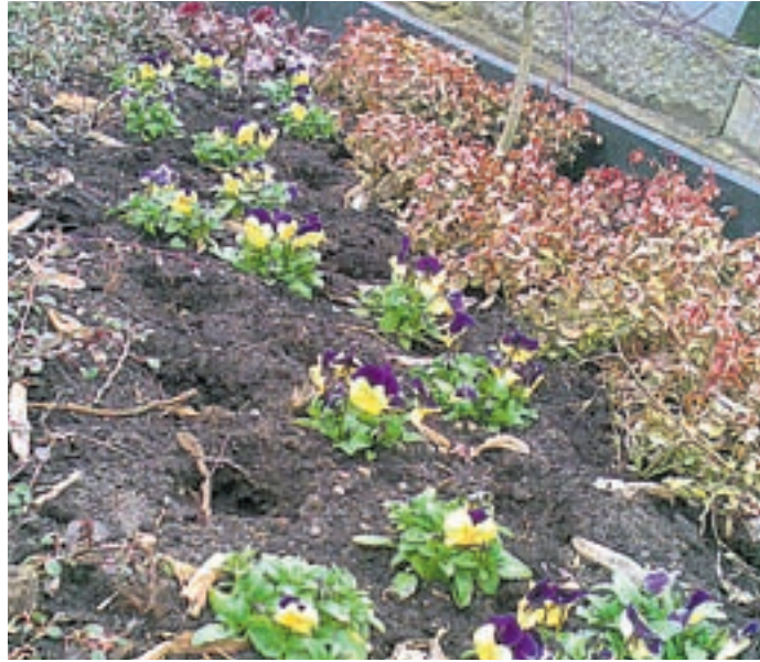
Kaum eingepflanzt, schon wieder herausgerissen: Grabschmuck in Dabendorf. "Wer tut bloß so etwas Unanständiges?" fragt sich nicht nur die Ehefrau des Verstorbenen.