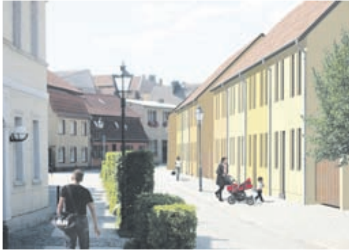
Moderne Häuser passen sich harmonisch an die alte Bausubstanz an und schließen hässliche Lücken in der Zossener Marktstraße.

ständigen Gremien geschickt wird. In ihren Vorschlägen und Beschlussvorlagen, muss die Verwaltung, natürlich auch begründen, warum sie die gewählten Vertreter der Stadt für eine