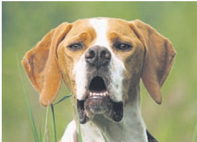
Freundlich und gut erzogen. Sein einziges Problem: Herrchen und Frauchen lassen seine Haufen liegen. Peinlich!!!

die Idee längst privat übernommen: Immer häufiger sieht man nun auch in kleineren Gemeinden Menschen, die mit einer