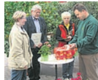
Gratulation von der Stadt.